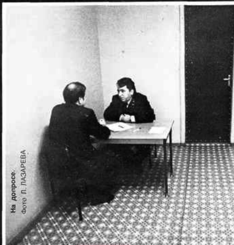
На допросе.

Человек должен иметь ясную перспективу повышения своего материального уровня законным путем. Кстати, проводимая ныне экономическая реформа и новая система хозяйствования должны радикально повлиять в этом плане на изменение материального уровня жизни трудящихся, спо-