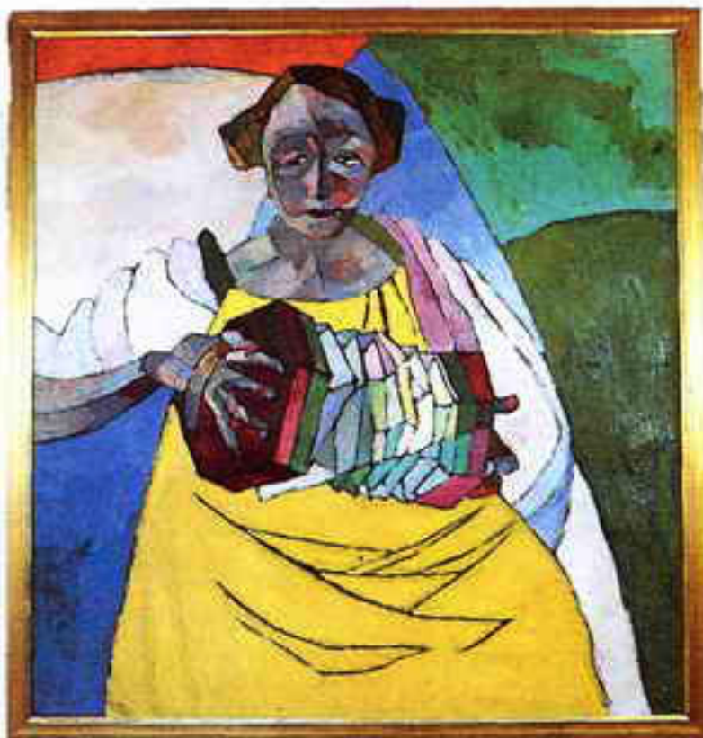
«Богоматерь Умиление». Конец XV в.; Ф. С. Рокотов. «Портрет кн. Е. А. Голицыной»; Г. Б. Якулов. «Портрет А. Г. Коонен»; А. В. Лентулов. «Гармонистка»; Ф. А. Малявин. «Рисунок».